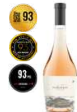
אורטוניה 45 פטגוניה רוזה יבש

תכולה: 750 מ"ל ברקוד: 7798130463187 גורם כפל: 6