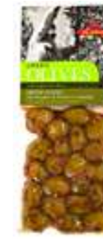
אילידה זיתים ירוקים עם אורגנו ופלפל אדום

תכולה: 150 גרם ברקוד: 5201955150047 גורם כפל: 15 כשר