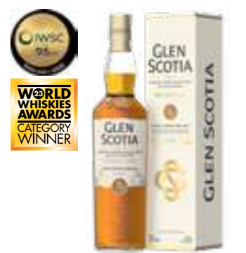
גלן סקוטיה דאבל קאסק סינגל מאלט

תכולה: 700 מ"ל ברקוד: 5016840261216 אחוז אלכוהול: 46% גורם כפל: 6