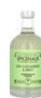
גין מלפפון ונענע

תכולה: 700 מ"ל ברקוד: 7290019714712 גורם כפל: 12 כשר