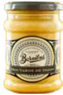
בורניבוס חרדל דיז'ון

תכולה: 245 גרם ברקוד: 3592860018600 גורם כפל: 6 כשר