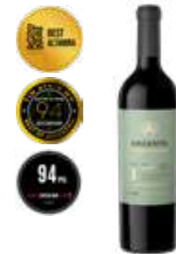
פינקה אלטה-מירה מלבק סינגל בלוק

תכולה: 750 מ"ל ברקוד: 7798130463514 גורם כפל: 6