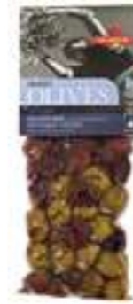
אילידה מיקס זיתים עם אורגנו

תכולה: 150 גרם ברקוד: 5201955150054 גורם כפל: 15 כשר