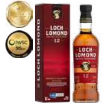
לוך לומונד 12 שנה סינגל מאלט

תכולה: 700 מ"ל ברקוד: 5016840155218 אחוז אלכוהול: 46% גורם כפל: 6 כשר