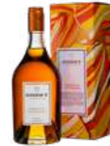
גודה XO פיין שמפיין 10 שנים

תכולה: 500 מ"ל ברקוד: 3278480396518 אחוז אלכוהול: 40% גורם כפל: 6