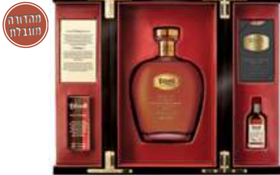
ליטל-מיל סינגל מאלט

גלן סקוטיה, סינגל מאלט סקוטי המגיע מהעיר קאמבלטאון. המזקה היחידה מבין שלושה שנשארה בעיר הבירה לוויסקי הסקוטי. גלן סקוטיה מגיע מאזור ייחודי באיים הדרומיים המערביים של סקוטלנד ונחשבת לאחת המזקות הייחודיות והנחשקות בעולם.