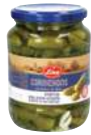
לינה קורנישון במלח

תכולה: 690 גרם ברקוד: 8901483010482 גורם כפל: 12 כשר