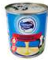
פריזיאן פלאג חלב מרוכז הולנדי

תכולה: 900 גרם ברקוד: 7290019286363 גורם כפל: 16 כשר