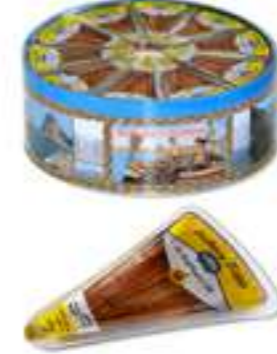
פילה אנשובי בשמן חמניות

תכולה: 80 גרם ברקוד: 8009867001207 גורם כפל: 50 כשר