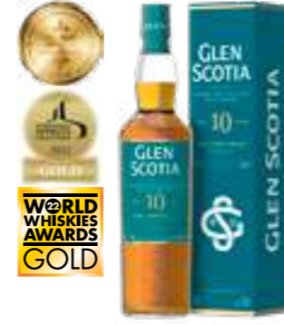
גלן סקוטיה 10 שנה סינגל מאלט

ליטל-מיל מזקת וויסקי מאלט סקוטי שנוסדה ב-1772, מה שהופך אותה לאחת המזקות העתיקות ביותר בסקוטלנד. החל משנת 1929 המזקה שינתה בעלות מספר פעמים עד שפורקה סופית בשנת 1997 לאחר שנרכשה ע"י קבוצת לוך לומונוד. בשנת 2004 שרדי המזקה נהרסו כליל בשריפה אך נמצאו חביות וויסקי אשר נשמרו היטב, שבוקבו ומשווקות מדי שנה בכמות מצומצמת וממוספרת של כ-1500 בקבוקים, מה שמאפשר לחובבי הוויסקי הזדמנות לטעום פיסת היסטוריה.