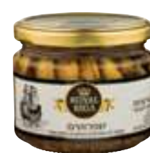
דגי שפרוטים מעושנים בשמן צמחי

תכולה: 280 גרם ברקוד: 7290017744162 גורם כפל: 12 כשר