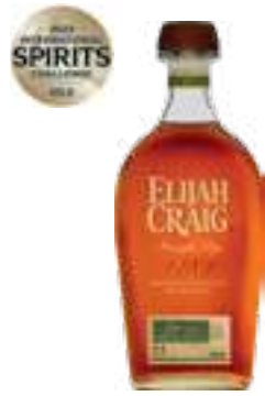
אלייזה קרייג ריי (שיפון)

תכולה: 700 מ"ל ברקוד: 096749004751 אחוז אלכוהול: 47% גורם כפל: 6 כשר