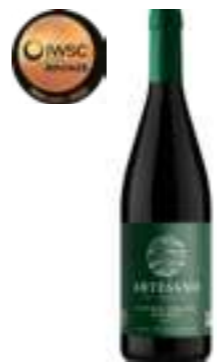
ארטסאנו מלבק אורגני

תכולה: 750 מ"ל ברקוד: 7798159560126 גורם כפל: 6