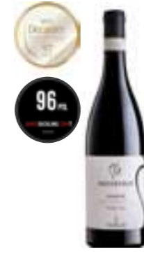
אמרונה מטרניגו רזרבה DOCG

תכולה: 750 מ"ל ברקוד: 8019171000070 גורם כפל: 6