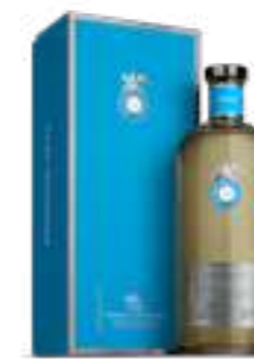
קאסה דרגונס רפוסאדו

תכולה: 700 מ"ל ברקוד: 736040537120 אחוז אלכוהול: 40% גורם כפל: 6