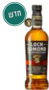
לוך לומונד אוריג'ינל מעושן

תכולה: 700 מ"ל ברקוד: 5016840313502 אחוז אלכוהול: 56.8% גורם כפל: 6