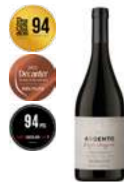
פינקה אגרלו מלבק

תכולה: 750 מ"ל ברקוד: 7798130463507 גורם כפל: 6