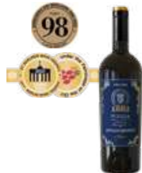
1882 אפימנטו פוליה תכולה: 750 מ"ל ברקוד: 8002793017250 גורם כפל: 6