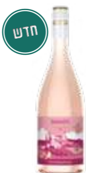
טוסקן וויבז רוסאטו ג'אוגרפיקו

תכולה: 750 מ"ל ברקוד: 8000757007620 גורם כפל: 6