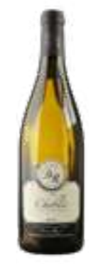
שבלי דניס רייס תכולה: 750 מ"ל ברקוד: 3760164290309 גורם כפל: 6