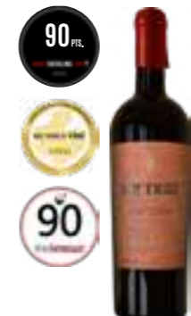
היסטריו אנפורה אורגני רוסו

תכולה: 750 מ"ל ברקוד: 8002793025057 גורם כפל: 6