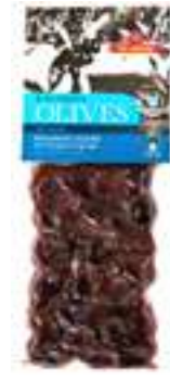
אילידה זיתי קלמטה

תכולה: 150 גרם ברקוד: 5201955150023 גורם כפל: 15 כשר