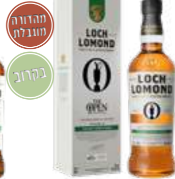
לוך לומונד אופן קיאנטי

תכולה: 700 מ"ל אחוז אלכוהול: 40% גורם כפל: 6