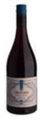
אנדיווידד פיננו נואר תכולה: 750 מ"ל ברקוד: 3500610117992 גורם כפל: 6