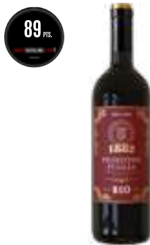
1882 פרימיטיו פוליה BIO תכולה: 750 מ"ל ברקוד: 8002793024296 גורם כפל: 6