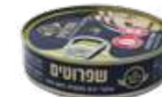
דגי שפרוטים מעושנים בשמן צמחי

תכולה: 250 גרם ברקוד: 7290014910515 גורם כפל: 12 כשר