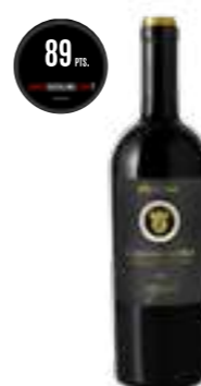
קולקסיונה אורו טוסקנה רוסי תכולה: 750 מ"ל ברקוד: 8002793017656 גורם כפל: 6