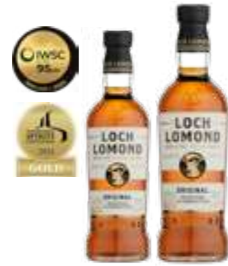
לוך לומונד - סינגל מאלט

תכולה: 700 מ"ל אחוז אלכוהול: 40% גורם כפל: 6