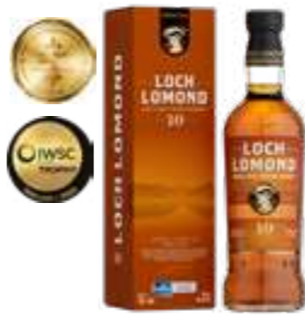
לוך לומונד 10 שנה סינגל מאלט

תכולה: 700 מ"ל ברקוד: 5016840747819 אחוז אלכוהול: 40% גורם כפל: 6