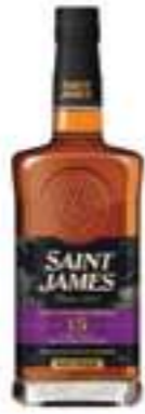
סיינט ג'יימס 15 שנים

תכולה: 700 מ"ל ברקוד: 3322177127029 אחוז אלכוהול: 43% גורם כפל: 6 כשר