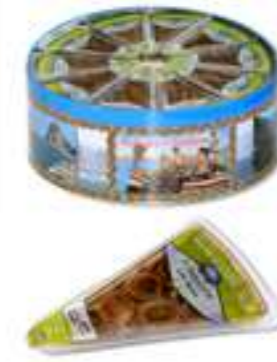
פילה אנשובי מגולגל עם צלפים

תכולה: 80 גרם ברקוד: 8009867006462 גורם כפל: 50 כשר