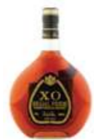
ברנדי רגאל פרייד XO

תכולה: 700 מ"ל ברקוד: 3278486542087 אחוז אלכוהול: 40% גורם כפל: 12 כשר