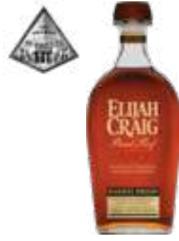
אלייזה קרייג חוזק חבית 12 שנה

תכולה: 700 מ"ל ברקוד: 096749004751 אחוז אלכוהול: 47% גורם כפל: 6 כשר