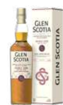
גלן סקוטיה דאבל קאסק סיומת רום סינגל מאלט

תכולה: 700 מ"ל ברקוד: 5016840150213 אחוז אלכוהול: 53.3% גורם כפל: 6