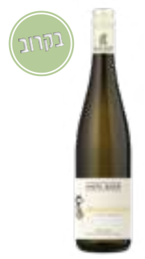
האנס בר פיננו גריניו תכולה: 750 מ"ל ברקוד: 4049366003771 גורם כפל: 6

האנס בר, בהשראת הדוב מדגל ברלין, מטייל בעולם על אופניו, נושא את היינות הייחודיים של ריינהסן לדור חדש של חובבי יין. ריינהסן, אזור היין הגדול והמגוון בגרמניה, משלב מסורות עתיקות עם חדשנות של דור ייננים צעיר ונלהב. תחת השראה זו, נבחרו בקפידה תשעה זנים ייחודיים, המשלבים איכות ואופנתיות ומתאימים לכל אירוע, כמו עיר הולדתו של האנס בר - ברלין.