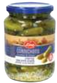
לינה קורנישון בחומץ

תכולה: 690 גרם ברקוד: 8901483010505 גורם כפל: 12 כשר