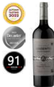
קברנה פרנק - רזרבה

תכולה: 750 מ"ל ברקוד: 7798159560225 גורם כפל: 6