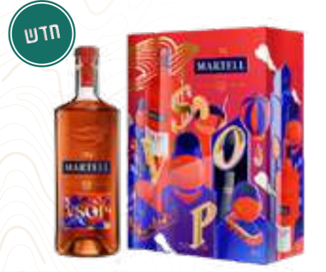
מארז מרטל VSOP + 2 כוסות

תכולה: 700 מ"ל ברקוד: 3219820006186 אחוז אלכוהול: 40% גורם כפל: 6