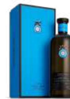
קאסה דרגונס אניחו

תכולה: 700 מ"ל ברקוד: 850005002321 אחוז אלכוהול: 40% גורם כפל: 6