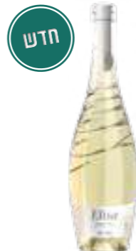
אליסה סנג'ובזה ביאנקו

תכולה: 750 מ"ל ברקוד: 8002793032062 גורם כפל: 6