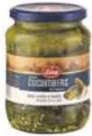
לינה מלפפונים בחומץ

תכולה: 690 גרם ברקוד: 8901483010505 גורם כפל: 12 כשר