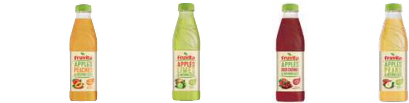
תפוחי עץ ואפרסק תכולה: 800 מ"ל ברקוד: 8606030051764 גורם כפל: 6 כשר תפוחי עץ וליים תכולה: 800 מ"ל ברקוד: 8606030051801 גורם כפל: 6 כשר תפוחי עץ ודובדבנים תכולה: 800 מ"ל ברקוד: 8606030051795 גורם כפל: 6 כשר תפוחי עץ ואגסים תכולה: 800 מ"ל ברקוד: 8606030051788 גורם כפל: 6 כשר