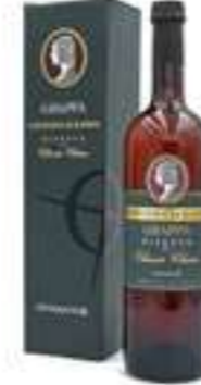
גראפה קונסטה די ראדה רזרבה תכולה: 750 מ"ל ברקוד: 8000757000744 גורם כפל: 6