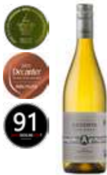
שרדונה - רזרבה

תכולה: 750 מ"ל ברקוד: 7798159560225 גורם כפל: 6