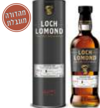
לוך לומונד חבית יחידנית 2014

תכולה 700 מ"ל ברקוד: 5016840132851 אחוז אלכוהול: 40% גורם כפל: 6