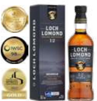
לוך לומונד 12 שנה אינצ'מואן

תכולה: 700 מ"ל ברקוד: 5016840835206 אחוז אלכוהול: 46% גורם כפל: 6 כשר