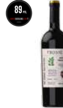
פרוסאה קוסטה רוסי אורגני תכולה: 750 מ"ל ברקוד: 8002793022711 גורם כפל: 6