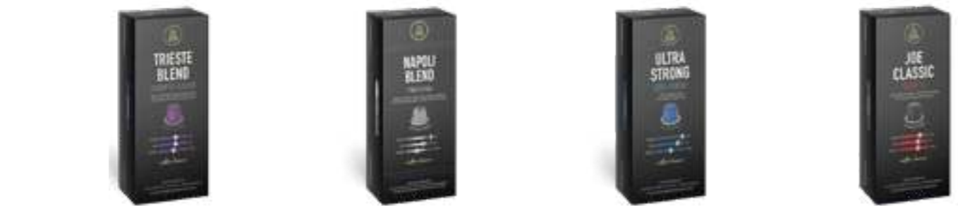
קפסולות תערובת טריאסטה תכולה: 55 גרם ברקוד: 7290105999214 גורם כפל: 16 כשר קפסולות תערובת נאפולי תכולה: 55 גרם ברקוד: 7290105999665 גורם כפל: 16 כשר קפסולות תערובת אולטרה תכולה: 55 גרם ברקוד: 7290105999054 גורם כפל: 16 כשר קפסולות תערובת ג'ו תכולה: 55 גרם ברקוד: 7290105999306 גורם כפל: 16 כשר

מותג פרוויטה הוא משקה סחוט טבעי המופק מ-100% פרי, ללא תוספי סוכר, וחומרים משמרים. ייצור פרוויטה נעשה במפעל הממוקם באזור המפורסם ביותר בסרביה לגידול פירות, במקום בו זורם נהר הדנובה ומצויות גבעות אינסופיות של אדמה פורייה עם מסורת גידול פירות בת מאות שנים של המקום, עם דגש על איכות פרי ידועה. באזור זה מגדלים אפרסק ותפוח במשך מאות שנים, וגידול הפירות הפך לחלק בלתי נפרד מתרבות המקום ולשם נרדף לגידולים הטובים ביותר של הפירות הללו.