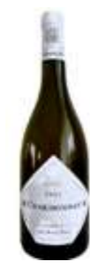
שרדונה תכולה: 750 מ"ל ברקוד: 3770000016659 גורם כפל: 6