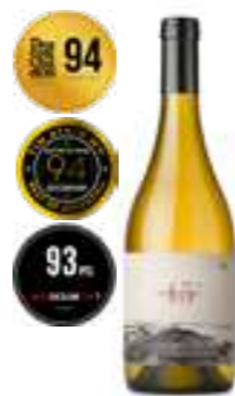
אורטוניה 45 פטגוניה לבן יבש

תכולה: 750 מ"ל ברקוד: 7798130465853 גורם כפל: 6