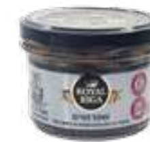
דגי שפרוטים מעושנים בשמן צמחי

תכולה: 170 גרם ברקוד: 7290019286387 גורם כפל: 24 כשר