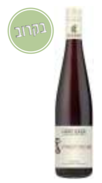
האנס בר פיננו נואר תכולה: 750 מ"ל ברקוד: 4049366003788 גורם כפל: 6