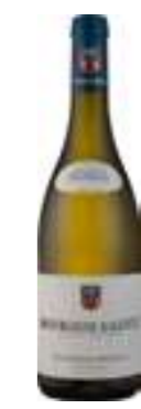
אליגוטה לבן יבש תכולה: 750 מ"ל ברקוד: 3357400500010 גורם כפל: 6