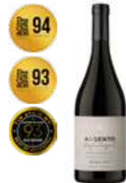
פינקה אלטה-מירה מלבק

תכולה: 750 מ"ל ברקוד: 7798159560232 גורם כפל: 6