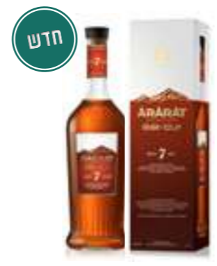
אררט אני 7 שנים

תכולה: 700 מ"ל ברקוד: 4850001001942 אחוז אלכוהול: 40% גורם כפל: 12