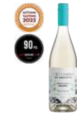
ארטסאנו מלבק לבן אורגני

תכולה: 750 מ"ל ברקוד: 7798130465846 גורם כפל: 6