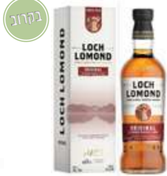
לוך לומונד אוריג'ינל שרי אולורוסו

תכולה: 700 מ"ל אחוז אלכוהול: 40% גורם כפל: 6