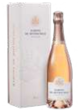
רוזה יבש במיוחד

תכולה: 750 מ"ל ברקוד: 3760183180018 גורם כפל: 6