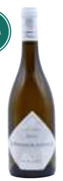
אליגוטה תכולה: 750 מ"ל ברקוד: 3770000016659 גורם כפל: 6