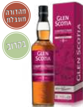
גלן סקוטיה קמפבלטאון 9 שנים 2025

תכולה: 700 מ"ל ברקוד: 5016840639251 אחוז אלכוהול: 57.1% גורם כפל: 6