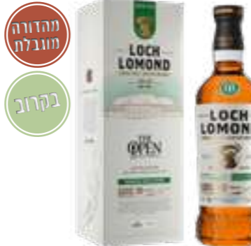
לוך לומונד אופן 22 שנים

תכולה: 700 מ"ל אחוז אלכוהול: 40% גורם כפל: 6