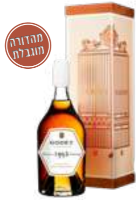
גודה וינטאז' חבית יחידנית 1992

תכולה: 700 מ"ל ברקוד: 3278485937181 אחוז אלכוהול: 43% גורם כפל: 6 כשר