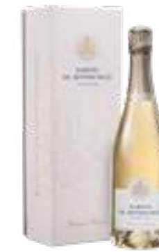
בלאן דה בלאן יבש במיוחד

תכולה: 750 מ"ל ברקוד: 3760183181473 גורם כפל: 6