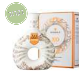
גודה XO TERRE קרמיקה

תכולה: 700 מ"ל ברקוד: 3278480396334 אחוז אלכוהול: 40% גורם כפל: 6 כשר