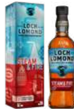
לוך לומונד - סטים & פייר

תכולה 700 מ"ל ברקוד: 5016840031222 אחוז אלכוהול: 40% גורם כפל: 12 כשר