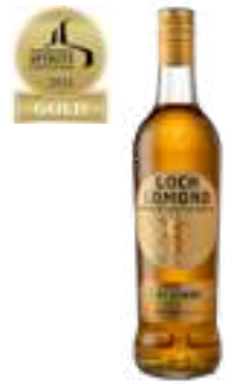
לוך לומונד - רזרב בלנדד

מוקמת באזור ה-HIGHLANDS, סקוטלנד. עדויות ראשונות למזקקה קיימות עוד משנת 1814. עד שנת 1994 המזקקה סיפקה בעיקר וויסקי GRAIN לשאר האי, היום, מזקקת לוך לומונד נחשבת למזקקה הורסטילית ביותר בסקוטלנד, עם דוד זיקוק המשלב טכנולוגיה חדשנית ובית מלאכה לחביות, אין סוג של וויסקי של לוך לומונד לא יודעים ליצור. המגוון מדבר בעד עצמו.