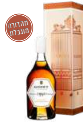
גודה וינטאז' חבית יחידנית 1990

תכולה: 700 מ"ל ברקוד: 3278485937167 אחוז אלכוהול: 43% גורם כפל: 6 כשר