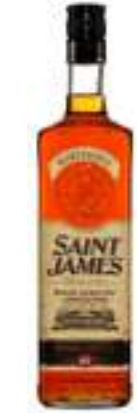
סיינט ג'יימס רויאל אמבר

סיינט ג'יימס הינו רוֹם אגריקול מהאי מרטיניק שבקאריביים, זהו סוג רוֹם ייחודי בכך שמופק ממיץ קנה סוכר הנמצא תחת פיקוח AOC של צרפת, רוֹם בעל פרופיל טעם מלא באופי, עשבוניות לצד יובש ושימוש מוקפד בחביות ליישון הביטויים הגבוהים. חובבי קוניאק משובח יהנו מלגימה של רוֹם נפלא הזה.