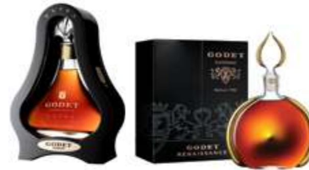
גודה אקסטרה 45 שנה

תכולה: 700 מ"ל ברקוד: 3278485937174 אחוז אלכוהול: 43% גורם כפל: 6 כשר