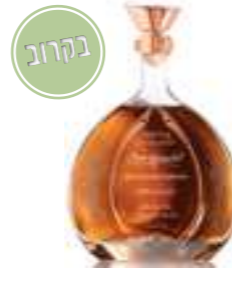
דון רמון אקסטרה אניחו

תכולה: 700 מ"ל אחוז אלכוהול: 40% גורם כפל: 6