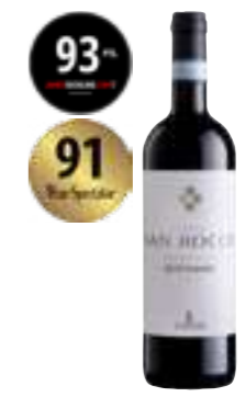
קאפיטל סאן רוקו ריפאסו DOC

תכולה: 750 מ"ל ברקוד: 8019171000193 גורם כפל: 6