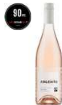
ארטסאנו רוזה אורגני

תכולה: 750 מ"ל ברקוד: 7798130464634 גורם כפל: 6