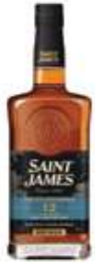
סיינט ג'יימס 12 שנים

תכולה: 700 מ"ל ברקוד: 3322177127029 אחוז אלכוהול: 43% גורם כפל: 6 כשר