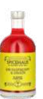
גין רסברי מיול

תכולה: 500 מ"ל ברקוד: 693493175463 גורם כפל: 12 כשר