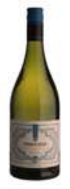
אנדיווידד שרדונה תכולה: 750 מ"ל ברקוד: 3500610118005 גורם כפל: 6