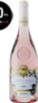
קולקסיונה פריבטה רוסיאנו תכולה: 750 מ"ל גורם כפל: 6