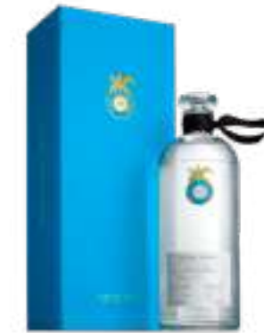
קאסה דרגונס חובן

תכולה: 700 מ"ל ברקוד: 850005002420 אחוז אלכוהול: 40% גורם כפל: 6