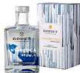
גודה אנטרקטיקה - קוניאק שקוף

תכולה: 750 מ"ל ברקוד: 3278486420545 אחוז אלכוהול: 17% גורם כפל: 6