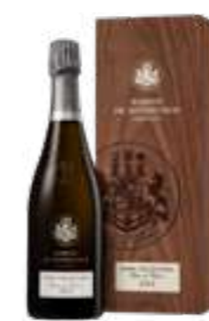
בלאן דה בלאן יבש בציר 2012

תכולה: 750 מ"ל ברקוד: 3760183180001 גורם כפל: 6