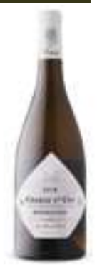
שבלי פרימייר קרו תכולה: 750 מ"ל ברקוד: 3770000016826 גורם כפל: 6