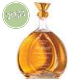
דון רמון אניחו

תכולה: 700 מ"ל אחוז אלכוהול: 40% גורם כפל: 6