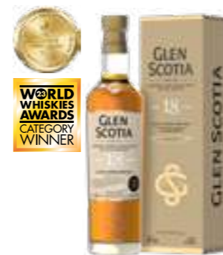
גלן סקוטיה 18 שנה סינגל מאלט

תכולה: 700 מ"ל ברקוד: 5016840712213 אחוז אלכוהול: 56.5% גורם כפל: 6