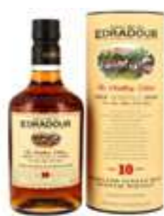
אדראדור 10 שנה סינגל מאלט

תכולה: 700 מ"ל ברקוד: 5016840192220 אחוז אלכוהול: 54.2% גורם כפל: 6