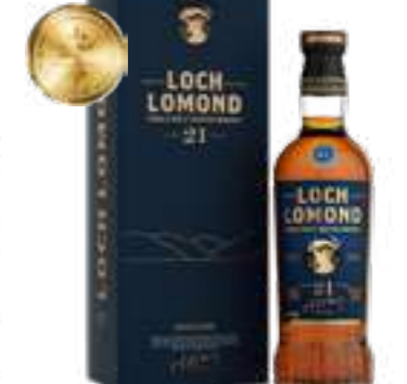
לוך לומונד 21 שנה סינגל מאלט

תכולה: 700 מ"ל ברקוד: 5016840739215 אחוז אלכוהול: 46% גורם כפל: 6 כשר