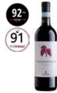
ואלפוליצ'לה סופיריור DOC

תכולה: 750 מ"ל ברקוד: 8019171000018 גורם כפל: 6