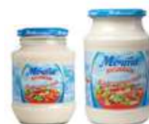
מצ'טה חוזייקי מיונז קלאסי

תכולה: 873 גרם / 466 גרם ברקוד: 4601576004025/4601576004032 גורם כפל: 12 / 6 כשר