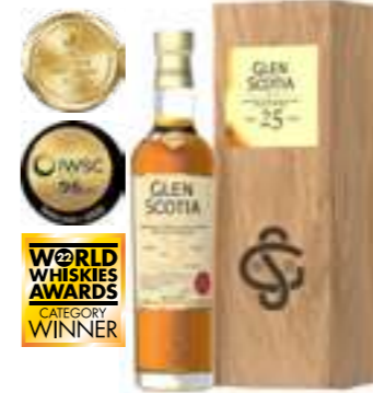
גלן סקוטיה 25 שנה סינגל מאלט

תכולה: 700 מ"ל ברקוד: 5016840181200 אחוז אלכוהול: 46% גורם כפל: 6