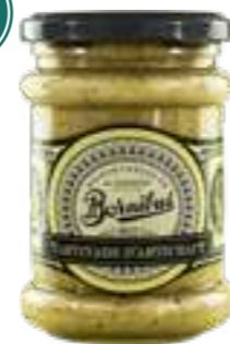
בורניבוס ממרח ארטישוק

תכולה: 250 גרם ברקוד: 3592860018440 גורם כפל: 6 כשר