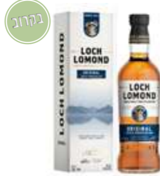
לוך לומונד אוריג'ינל טריפל אוק

תכולה: 700 מ"ל אחוז אלכוהול: 40% גורם כפל: 6