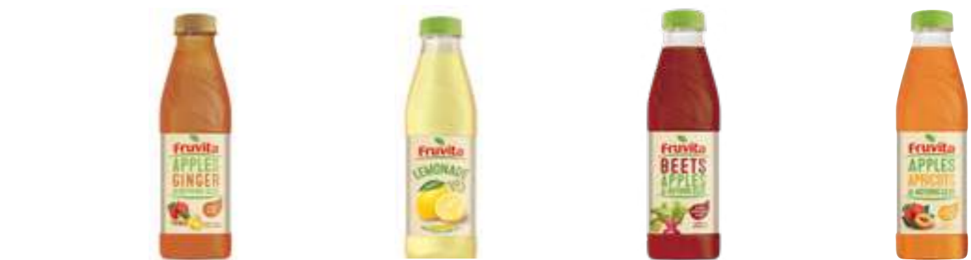
תפוחי עץ וג'ינג'ר תכולה: 800 מ"ל ברקוד: 8606030051832 גורם כפל: 6 כשר לימונדה תכולה: 800 מ"ל ברקוד: 8606030051757 גורם כפל: 6 כשר תפוחי עץ וסלק תכולה: 800 מ"ל ברקוד: 8606030051818 גורם כפל: 6 כשר תפוחי עץ ומשמש תכולה: 800 מ"ל ברקוד: 8606030051771 גורם כפל: 6 כשר