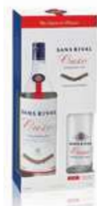
אוזו סאנס ריבל - מארז

תכולה: 700 מ"ל ברקוד: 5201484021016 אחוז אלכוהול: 40% גורם כפל: 6 כשר