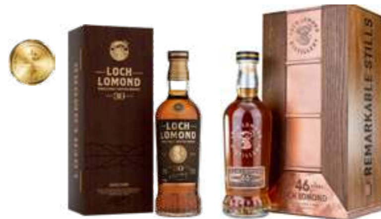
לוך לומונד 30 שנה סינגל מאלט

תכולה: 1 ליטר / 700 מ"ל ברקוד: 5016840033219 / 5016840033615 אחוז אלכוהול: 40% גורם כפל: 6 כשר