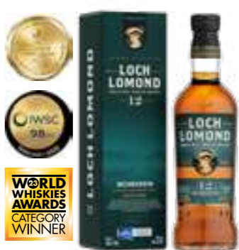
לוך לומונד 12 שנה אינשמורין

תכולה: 700 מ"ל ברקוד: 5016840155300 אחוז אלכוהול: 46% גורם כפל: 6 כשר