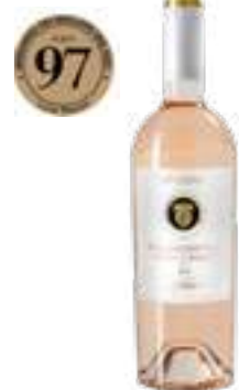
קולקסיונה אורו רוסיאנו טוסקנה תכולה: 750 מ"ל ברקוד: 8002793017649 גורם כפל: 6

CAMPAIGN FINANCED ACCORDING TO EU REG. N. 2021/2115