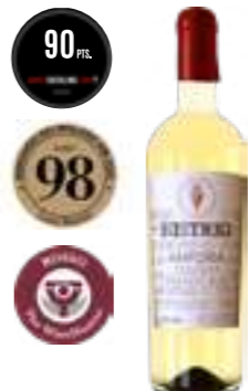
היסטריו אנפורה אורגני ביאנקו

תכולה: 750 מ"ל ברקוד: 8002793022964 גורם כפל: 6