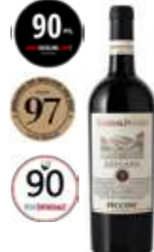
סאסו אל פוג'יו טוסקנה IGT תכולה: 750 מ"ל ברקוד: 8002793001228 גורם כפל: 6