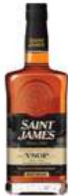
סיינט ג'יימס VSOP

תכולה: 700 מ"ל ברקוד: 3147699119198 אחוז אלכוהול: 43% גורם כפל: 6 כשר