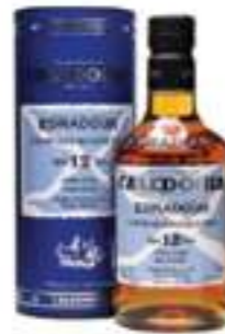
אדראדור קלדוניה 12 שנה סינגל מאלט

תכולה: 700 מ"ל ברקוד: 5021944129102 אחוז אלכוהול: 46% גורם כפל: 6