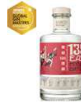
135° איסט היאוגו דריי ג'ין

תכולה: 1 ליטר ברקוד: 3255537512046 אחוז אלכוהול: 55% גורם כפל: 6 כשר