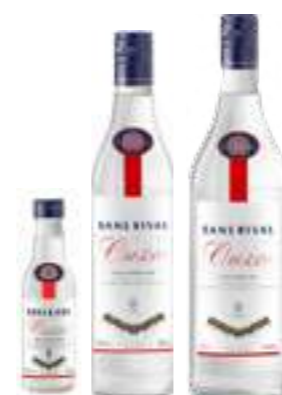
אוזו סאנס ריבל

תכולה: 700 מ"ל ברקוד: 5201484021016 אחוז אלכוהול: 40% גורם כפל: 6 כשר