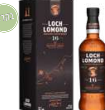
לוך לומונד 16 שנה וויפוינט

תכולה: 700 מ"ל ברקוד: 5016840747819 אחוז אלכוהול: 46% גורם כפל: 6 כשר