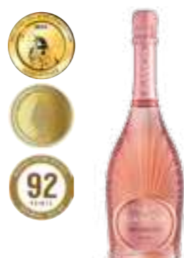
גנצ'יה פרוסקו רוזה יבש

תכולה: 750 מ"ל ברקוד: 8000420742193 גורם כפל: 6