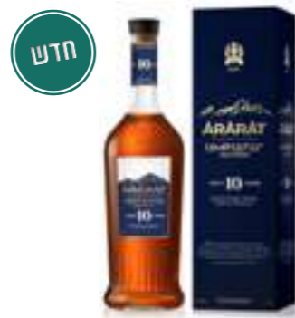
אררט אחטמר 10 שנים

מותג הברנדי הארמני המפורסם ביותר, המזוקק בעיר ירוואן מאז 1887. מיוצר מענבים מקומיים וישון בחביות עץ אלון קווקזי, הוא מציע פרופיל עשיר וחלק עם ניחוחות פירות יבשים, דבש, וניל ותבלינים עדינים. סדרת הברנדים של אררט כוללת ביטויים מגוונים, החל מגרסאות צעירות ורעננות ועד למהדורות מיושנות ויוקרתיות. זהו ברנדי בעל היסטוריה עמוקה, המשמש כסמל למסורת ותרבות ארמנית.