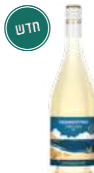
טוסקן וויבז ורמנטינו ג'אוגרפיקו

תכולה: 750 מ"ל ברקוד: 8000757007668 גורם כפל: 6