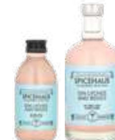
גין ליצי' ורדים

תכולה: 500 מ"ל / 200 מ"ל ברקוד: 693493175135/693493175456 גורם כפל: 12/24 כשר