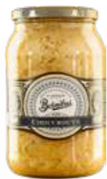
בורניבוס חרדל דיז'ון

תכולה: 250 גרם ברקוד: 3592860018617 גורם כפל: 6 כשר