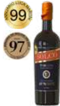
סולקו אפיטו תכולה: 750 מ"ל ברקוד: 8002793020090 גורם כפל: 6