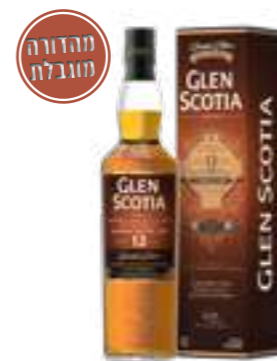
גלן סקוטיה 12 שנה סינגל מאלט

תכולה: 700 מ"ל ברקוד: 5016840313519 אחוז אלכוהול: 53.9% גורם כפל: 6