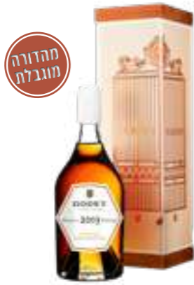
גודה וינטאז' חבית יחידנית 2003

תכולה: 700 מ"ל ברקוד: 3278485937181 אחוז אלכוהול: 43% גורם כפל: 6 כשר