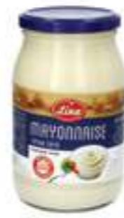
לינה מיונז קלאסי

תכולה: 430 גרם ברקוד: 7290012159275 גורם כפל: 10 כשר