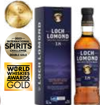
לוך לומונד 18 שנה סינגל מאלט

תכולה 700 מ"ל ברקוד: 5016840216216 אחוז אלכוהול: 40% גורם כפל: 6