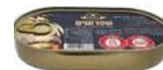
דגי שפרוטים מעושנים בשמן צמחי

תכולה: 160 גרם ברקוד: 7290019286394 גורם כפל: 24 כשר