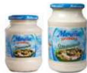
מצ'טה חוזייקי מיונז זיתים

תכולה: 873 גרם / 466 גרם ברקוד: 4601576010170/4601576010101 גורם כפל: 12 / 6 כשר