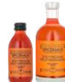
ספייסי מרגריטה פסיפלורה

תכולה: 200 מ"ל ברקוד: 50413874 גורם כפל: 24 כשר