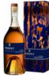
גודה ספישל סלקשן

תכולה: 500 מ"ל ברקוד: 3278481003002 אחוז אלכוהול: 40% גורם כפל: 8 כשר