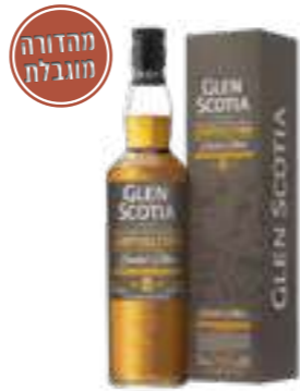
גלן סקוטיה קמפבלטאון 8 שנים 2022

תכולה: 700 מ"ל ברקוד: 5016840271215 אחוז אלכוהול: 54.3% גורם כפל: 6