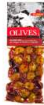
אילידה מיקס זיתים עם אורגנו ופלפל אדום

תכולה: 150 גרם ברקוד: 5201955150047 גורם כפל: 15 כשר