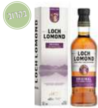
לוך לומונד אוריג'ינל חבית ריחה

תכולה: 700 מ"ל אחוז אלכוהול: 40% גורם כפל: 6