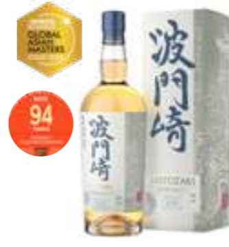
האטוזקי פיור מאלט

תכולה: 700 מ"ל ברקוד: 4970860800002 אחוז אלכוהול: 40% גורם כפל: 6