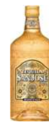
סאן חוזה גולד

תכולה: 700 מ"ל ברקוד: 3107872600394 אחוז אלכוהול: 35% גורם כפל: 6 כשר