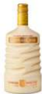
גודה ליקר קרם דה לה קרם

תכולה: 700 מ"ל ברקוד: 3278480629128 אחוז אלכוהול: 40% גורם כפל: 6 כשר