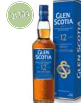
גלן סקוטיה 12 שנה סינגל מאלט

תכולה: 700 מ"ל ברקוד: 5016840772262 אחוז אלכוהול: 40% גורם כפל: 6 כשר