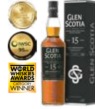
גלן סקוטיה 15 שנה סינגל מאלט

תכולה: 700 מ"ל אחוז אלכוהול: 40% גורם כפל: 6