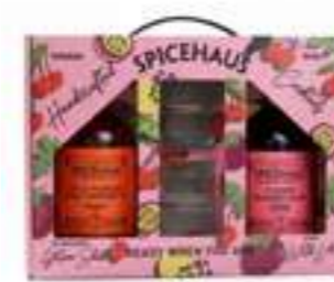
מארז זוגי+ 2 כוסות

תכולה: 700 מ"ל ברקוד: 693493175418 גורם כפל: 1 כשר