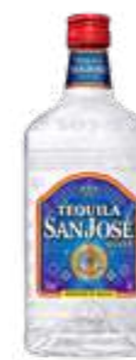
סאן חוזה סילבר

תכולה: 1 ליטר / 700 מ"ל / 200 מ"ל ברקוד: 5202413607004 / 5201484023003 / 5201484022006 אחוז אלכוהול: 40% גורם כפל: 12 / 6 / 24 כשר