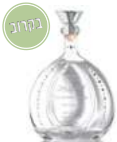
דון רמון בלנקו

טקילה קאסה דון רמון, שהוקמה ב-1996, מוקירה את המשקה, מקורותיו, ותרבות האגבה. בעזרת אגבה כחולה מאזור Jalisco ושילוב בין מסורת לטכנולוגיה חדשנית, אנו מייצרים טקילה באיכות יוצאת דופן. בזכות מאסטרי הטקילה שלנו ועקרונות קיימות, יצרנו מורשת של מעל 25 שנה וזכינו להכרה בינלאומית ופרסים רבים, המשקפים את גאוות מקסיקו בטקילה.