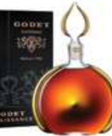
גודה רנסנס 70 שנה

תכולה: 700 מ"ל ברקוד: 3278480629234 אחוז אלכוהול: 40% גורם כפל: 1 כשר