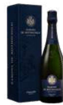
קונקורדיה יבש במיוחד

תכולה: 750 מ"ל ברקוד: 8000420017413 גורם כפל: 6