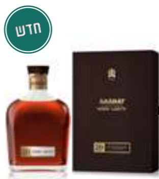
אררט נהאירי 20 שנים

תכולה: 700 מ"ל ברקוד: 4850001002031 אחוז אלכוהול: 40% גורם כפל: 12