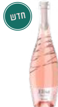
אליסה סנג'ובזה רוסאטו

סדרת קורטה דאי פאצי של בית היין האיטלקי פיצ'יני משלבת אומנות ומסורת בייצור יין מטוסקנה. הסדרה כוללת יינות אדומים ולבנים המתאפיינים בארומות עשירות, מבנה מורכב וטעמים מאוזנים. מיועדת לחובבי יין המחפשים חוויה אותנטית המשלבת מסורת ואיכות עם חדשנות.