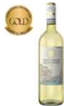
פינו גריג'ו דה לה ונציה IGT

תכולה: 750 מ"ל ברקוד: 8000757007644 גורם כפל: 6