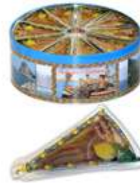
פילה אנשובי בשמן חמניות ולימון

תכולה: 80 גרם ברקוד: 8009867006462 גורם כפל: 50 כשר