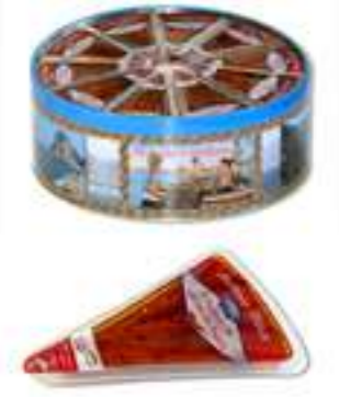
פילה אנשובי בשמן חמניות וצ'ילי

תכולה: 80 גרם ברקוד: 8009867002518 גורם כפל: 50 כשר