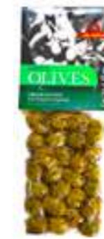
אילידה זיתים ירוקים עם אורגנו

תכולה: 150 גרם ברקוד: 5201955150054 גורם כפל: 15 כשר