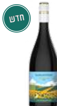
טוסקן וויבז סנג'ובזה ג'אוגרפיקו

תכולה: 750 מ"ל ברקוד: 8002793032048 גורם כפל: 6