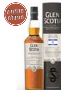
גלן סקוטיה חבית ייחודית 2015

אדראדור היא אחת המזקות הקטנות ביותר בסקוטלנד הממוקמת בפיטלוכרי, במרכז ההיילנדס. גודלה הקטן של המזקה מאפשר לה לייצר וויסקי בכמויות מוגבלות, מה שמביא לביטויים ייחודיים וחביות שנדייר לשים עליהן את היד. לוויסקי היוצא מהמזקה יש לרוב אופי עשיר, מתוק ופירותי, עם התמקדות באומנות מסורתית.