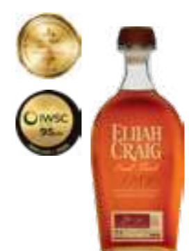
אלייזה קרייג סמול באטצ'

תכולה: 700 מ"ל ברקוד: 96749750009 אחוז אלכוהול: משתנה גורם כפל: 6 כשר