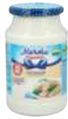
מצ'טה חוזייקי מיונז שמנת

תכולה: 900 גרם ברקוד: 4601576009839 גורם כפל: 6 כשר