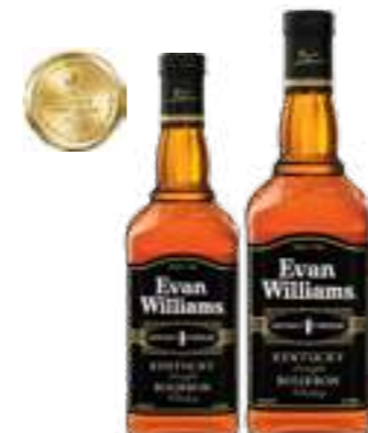
אואן ויליאמס בלאק לייבל

תכולה: 700 מ"ל ברקוד: 96749021802 אחוז אלכוהול: 32.5% גורם כפל: 6