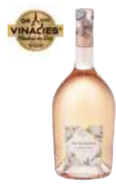
ויקטורין - יין רוזה תכולה: 750 מ"ל ברקוד: 3500610144806 גורם כפל: 6