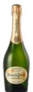
פרייה-ד'ואה גראן ברוט

תכולה: 750 מ"ל ברקוד: 3113880105110 גורם כפל: 6