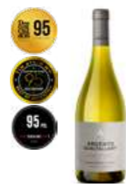
פינקה גואלטאלארי שרדונה

תכולה: 750 מ"ל ברקוד: 7798325470228 גורם כפל: 6