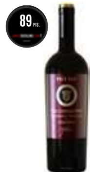
קולקסיונה אורו מארמה רזרבה תכולה: 750 מ"ל ברקוד: 8002793024333 גורם כפל: 6