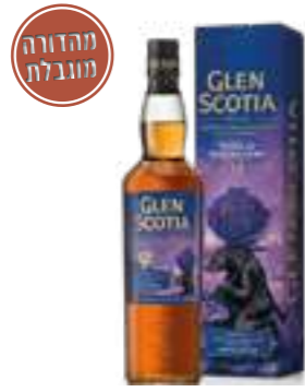
גלן סקוטיה 12 שנה הזאב - האייקונים של קמפבלטאון

תכולה: 700 מ"ל ברקוד: 5016840639251 אחוז אלכוהול: 57.1% גורם כפל: 6