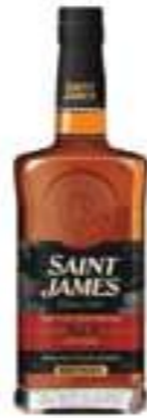
סיינט ג'יימס XO

תכולה: 700 מ"ל ברקוד: 3147699119013 אחוז אלכוהול: 43% גורם כפל: 6 כשר