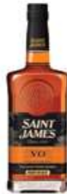
סיינט ג'יימס VO

תכולה: 700 מ"ל ברקוד: 3147699113776 אחוז אלכוהול: 40% גורם כפל: 6 כשר