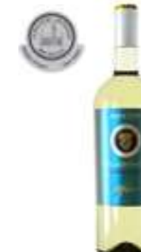
קולקסיונה אורו ורמנטינו תכולה: 750 מ"ל ברקוד: 8002793024319 גורם כפל: 6