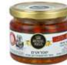
דגי שפרוטים מעושנים ועגבניות

תכולה: 150 גרם ברקוד: 5201955150030 גורם כפל: 15 כשר