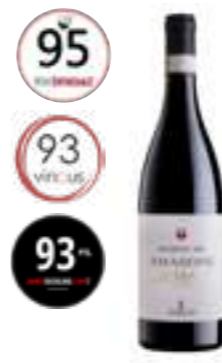
אמרונה מארנה 180 DOCG

'קנטין אירופה' הוא אחד היקבים הגדולים בסיציליה ואיגוד חשוב של כ-2000 כורמים, המעבדים 60 אלף דונם באזורי טראפני, אגריג'נטו ופלרמו. היקב, המוביל בעולם בייצור 'גרילו', 'קנטין אירופה', פרויקט הדגל של היקב, נועד לשפר ולשווק יינות אותנטיים תוך שמירה על המסורת הסיציליאנית. הוא שואב השראה ממגדל סיביליאנה ההיסטורי, שנבנה במאה ה-16 כחלק ממערכת מגדלי שמירה לאורך חופי סיציליה.