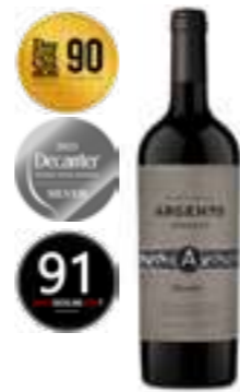
מלבק - רזרבה

תכולה: 750 מ"ל ברקוד: 7798130462425 גורם כפל: 6