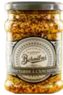
בורניבוס חרדל גרגירים

תכולה: 270 גרם ברקוד: 3592860018655 גורם כפל: 6 כשר