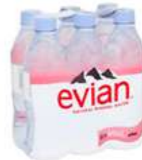
אוויון מים מינרליים - מארז שישיה

תכולה: 1.25 ליטר ברקוד: 4860019002077 גורם כפל: 6 כשר