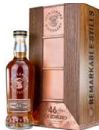
לוך לומונד 46 שנה סינגל מאלט

תכולה: 700 מ"ל ברקוד: 5016840709251 אחוז אלכוהול: 47% גורם כפל: 3