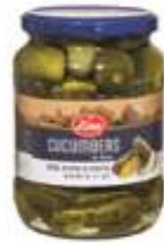
לינה מלפפונים במלח

תכולה: 690 גרם ברקוד: 7290014910386 גורם כפל: 12 כשר