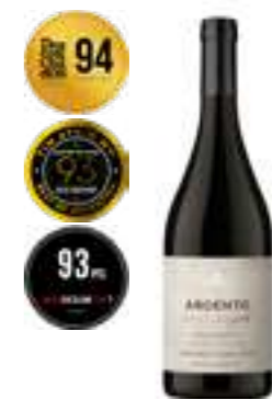
פינקה אגרלו קברנה פרנק

תכולה: 750 מ"ל ברקוד: 7798130465631 גורם כפל: 6