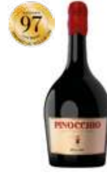
פינקו - רוסי דה אטליה תכולה: 750 מ"ל ברקוד: 8002793021196 גורם כפל: 6