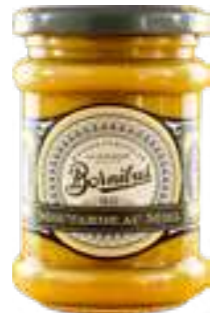
בורניבוס חרדל ודבש

תכולה: 270 גרם ברקוד: 3592860018747 גורם כפל: 6 כשר