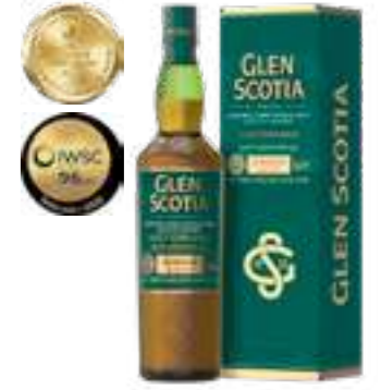
גלן סקוטיה ויקטוריאנה סינגל מאלט

תכולה: 700 מ"ל ברקוד: 5016840171218 אחוז אלכוהול: 46% גורם כפל: 6 כשר