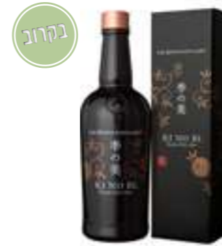
קי נו בי קיוטו דריי ג'ין

הג'ין נקרא על שם קו אורך East 135°. שילוב בוטניקה של ג'ין קלאסי יחד עם תיבול מסורתי המאפיין את יפן, בין המרכיבים ניתן למצוא - זרעי כוסברה, ערער, עלי שיסו, יוזו ופלפל סאנשו כל זאת יחד עם מרכיב "סודי" - הסאקה המפורסם של Akashi המעיד את החריפות מהפלפל ומעגל את הג'ין בצורה נפלאה.