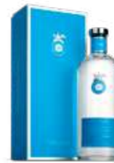
קאסה דרגונס בלאנקו

אומנות הטקילה במיטבה, כל בקבוק משלב אומנות מקסיקנית מסורתית עם ייצור מודרני ובר-קיימא. שדות האגבה בעמק טקילה צומחים על אדמה וולקנית עשירה, המעניקה לטקילה את טעמה הייחודי. תהליך מוקפד מתחיל בקציר ידני של אגבות בוגרות וממשיך בשימוש במי מעיינות טהורים. ייצור בכמויות קטנות ובקרת איכות קפדנית מבטיחים טקילה יוצאת דופן בכל פרט.