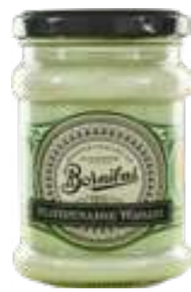
בורניבוס מיונד וואסאבי

תכולה: 220 גרם ברקוד: 3592860018815 גורם כפל: 6 כשר