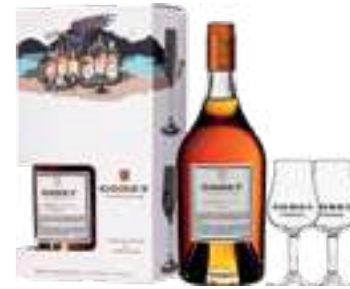
מארז גודה VSOP 2+ כוסות

תכולה: 700 מ"ל ברקוד: 3278480396327 אחוז אלכוהול: 40% גורם כפל: 6 כשר