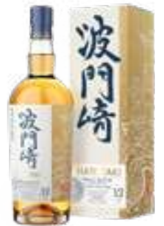
האטוזקי סינגל מאלט 12 שנה סיומת חביות הומז

תכולה: 700 מ"ל ברקוד: 096749000067 אחוז אלכוהול: 47% גורם כפל: 6 כשר