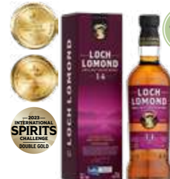
לוך לומונד 14 שנה סינגל מאלט

תכולה: 700 מ"ל ברקוד: 5016840266211 אחוז אלכוהול: 40% גורם כפל: 6