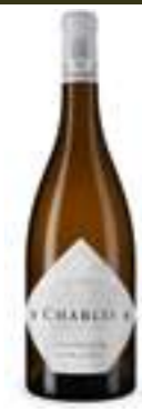
שבלי תכולה: 1.5 ליטר / 750 מ"ל ברקוד: 3770000016840 / 3770000016598 גורם כפל: 6/3