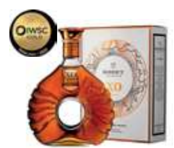
גודה XO TERRE 30 שנה

תכולה: 700 מ"ל אחוז אלכוהול: 40% גורם כפל: 6 כשר