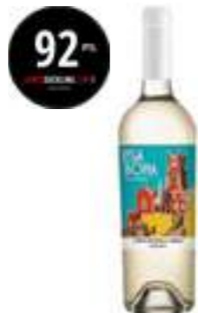
ליסה בונה רזרב לבן תכולה: 750 מ"ל ברקוד: 5600206949650 גורם כפל: 6