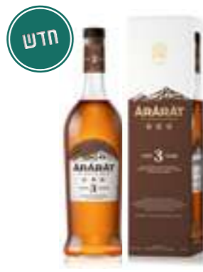
אררט 3 כוכבים

תכולה: 700 מ"ל ברקוד: 4850001007722 אחוז אלכוהול: 30% גורם כפל: 12