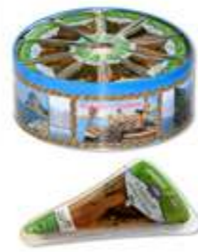
אנשובי בשמן עם פטרוזיליה ושום

תכולה: 250 גרם ברקוד: 3592860018440 גורם כפל: 6 כשר