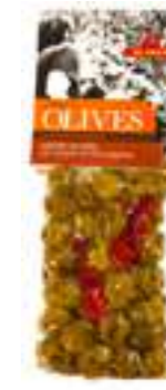
אילידה זיתים ירוקים עם אורגנו וצ'ילי

תכולה: 150 גרם ברקוד: 5201955150016 גורם כפל: 15 כשר