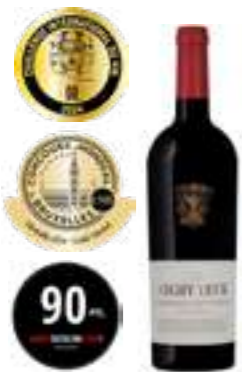
הברווז הזעם רזרב קברנה סוביניון תכולה: 750 מ"ל ברקוד: 5600206949421 גורם כפל: 6