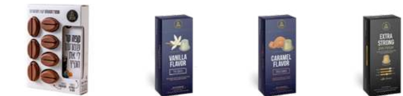
מארז קיץ קפסולות קפה ג'ו קר+ תבנית סיליקון תכולה: 55 גרם ברקוד: 7290015823227 גורם כפל: 10 כשר קפסולות תערובת וניל תכולה: 55 גרם ברקוד: 7290105999276 גורם כפל: 16 כשר קפסולות תערובת קרמל תכולה: 55 גרם ברקוד: 7290105999290 גורם כפל: 16 כשר קפסולות תערובת אקסטרה תכולה: 55 גרם ברקוד: 7290105999238 גורם כפל: 16 כשר