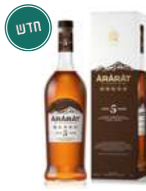
אררט 5 כוכבים

תכולה: 700 מ"ל ברקוד: 4850001001911 אחוז אלכוהול: 40% גורם כפל: 12