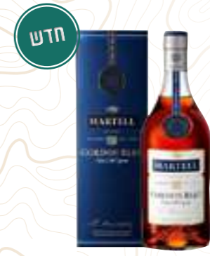
מרטל קורדון בלו

תכולה: 700 מ"ל ברקוד: 3219820005899 אחוז אלכוהול: 40% גורם כפל: 12