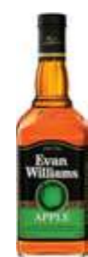
אואן ויליאמס ליקר תפוח על בסיס ברבן

תכולה: 700 מ"ל ברקוד: 4970860880189 אחוז אלכוהול: 46% גורם כפל: 6