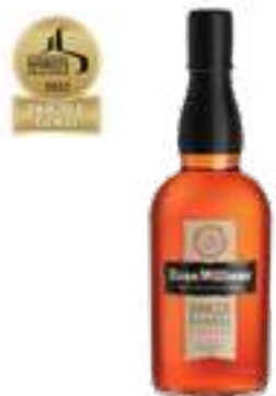
אואן ויליאמס סינגל בארל

תכולה: 700 מ"ל ברקוד: 967490213696 אחוז אלכוהול: 50% גורם כפל: 6 כשר