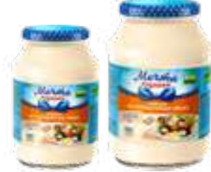
מצ'טה חוזייקי מיונז ביצי שליו

תכולה: 900 גרם ברקוד: 4601576009839 גורם כפל: 6 כשר