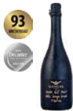
אלטה לאנגה ברוט רזבה 60 חודשים

תכולה: 750 מ"ל ברקוד: 8000420015556 גורם כפל: 6