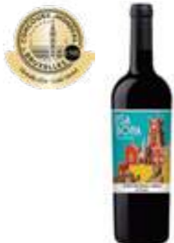
ליסה בונה רזרב אדום תכולה: 750 מ"ל ברקוד: 5600206949445 גורם כפל: 6