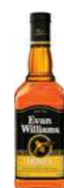
אואן ויליאמס ליקר דבש על בסיס ברבן

תכולה: 700 מ"ל ברקוד: 96749001071 אחוז אלכוהול: 32.5% גורם כפל: 6