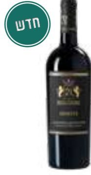
ג'נסי אליניקו דל ולטורה DOC תכולה: 750 מ"ל ברקוד: 8007674005678 גורם כפל: 6