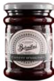
בורניבוס קונפי בצל