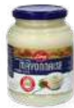
לינה מיונז קלאסי

תכולה: 397 גרם ברקוד: 8716200457590 גורם כפל: 48