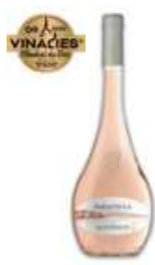
פרדיסולה - יין רוזה יבש תכולה: 750 מ"ל ברקוד: 3500610156007 גורם כפל: 6