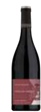
קוט דו רון

תכולה: 750 מ"ל ברקוד: 3500610096624 גורם כפל: 6