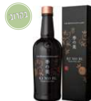
קי נו בי קיוטו דריי ג'ין

הג'ין נקרא על שם קו אורך East 135°. שילוב בוטניקה של ג'ין קלאסי יחד עם תיבול מסורתי המאפיין את יפן, בין המרכיבים ניתן למצוא - זרעי כוסברה, ערער, עלי שיסו, יוזו ופלפל סאנשו כל זאת יחד עם מרכיב "סודי" - הסאקה המפורסם של Akashi המעידן את החריפות מהפלפל ומעגל את הג'ין בצורה נפלאה.