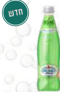
בורג'ומי לימונטי טרגון

תכולה: 500 מ"ל ברקוד: 4860019003067 גורם כפל: 12 כשר