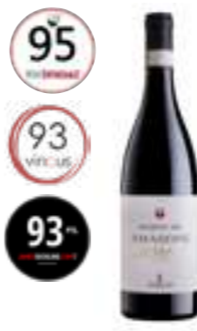
אמרונה מארנה 180 DOCG

'קנטין אירופה' הוא אחד היקבים הגדולים בסיציליה ואיגוד חשוב של כ-2000 כורמים, המעבדים 60 אלף דונם באזורי טראפני, אגריג'נטו ופלרמו. היקב, המוביל בעולם בייצור 'גרילו', 'קנטין אירופה', פרויקט הדגל של היקב, נועד לשפר ולשווק יינות אותנטיים תוך שמירה על המסורת הסיציליאנית. הוא שואב השראה ממגדל סיביליאנה ההיסטורי, שנבנה במאה ה-16 כחלק ממערכת מגדלי שמירה לאורך חופי סיציליה.