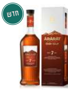
אררט אני 7 שנים

תכולה: 700 מ"ל ברקוד: 4850001001942 אחוז אלכוהול: 40% גורם כפל: 12