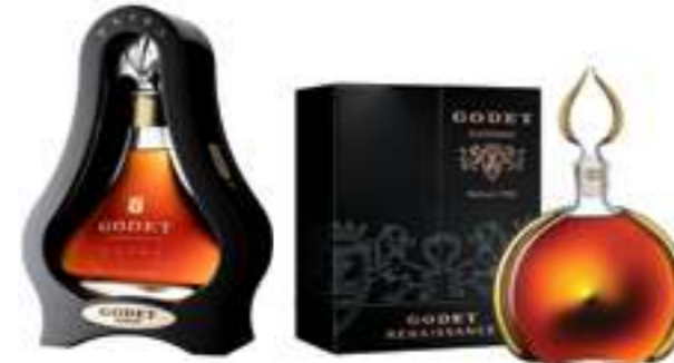
גודה אקסטרה 45 שנה

תכולה: 700 מ"ל ברקוד: 3278485937174 אחוז אלכוהול: 43% גורם כפל: 6 כשר