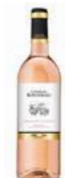
רוזה גרנאש סנזלט

תכולה: 750 מ"ל ברקוד: 3500610090394 גורם כפל: 6