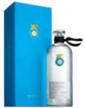
קאסה דרגונס חובן

תכולה: 700 מ"ל ברקוד: 850005002420 אחוז אלכוהול: 40% גורם כפל: 6