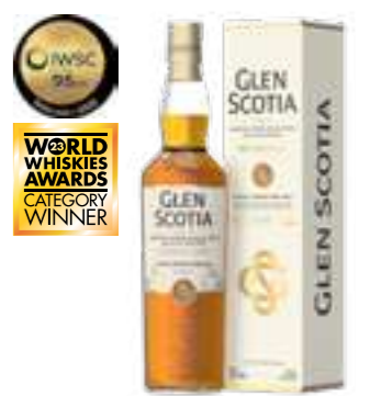
גלן סקוטיה דאבל קאסק סינגל מאלט

תכולה: 700 מ"ל ברקוד: 5016840261216 אחוז אלכוהול: 46% גורם כפל: 6