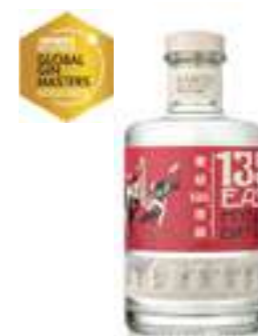
135° איסט היאוגו דריי ג'ין

תכולה: 1 ליטר ברקוד: 3255537512046 אחוז אלכוהול: 55% גורם כפל: 6 כשר