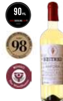
היסטריו אנפורה אורגני ביאנקו

תכולה: 750 מ"ל ברקוד: 8002793022964 גורם כפל: 6