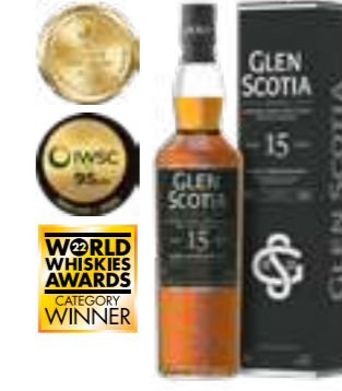
גלן סקוטיה 15 שנה סינגל מאלט

תכולה: 700 מ"ל אחוז אלכוהול: 40% גורם כפל: 6