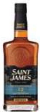
סיינט ג'יימס 12 שנים

תכולה: 700 מ"ל ברקוד: 3322177127029 אחוז אלכוהול: 43% גורם כפל: 6 כשר