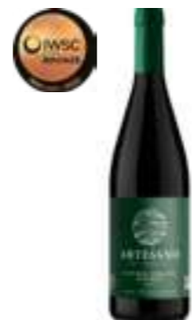
ארטסאנו מלבק אורגני

תכולה: 750 מ"ל ברקוד: 7798159560126 גורם כפל: 6