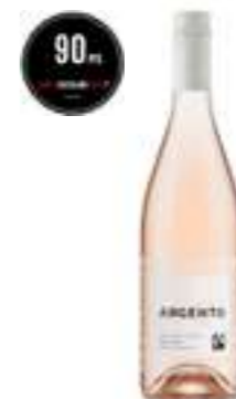
ארטסאנו רוזה אורגני

תכולה: 750 מ"ל ברקוד: 7798130464634 גורם כפל: 6