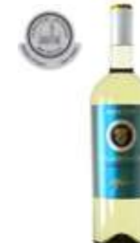
קולקסיונה אורו ורמנטינו תכולה: 750 מ"ל ברקוד: 8002793024319 גורם כפל: 6