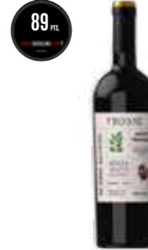
פרוסאה קוסטה רוסי אורגני תכולה: 750 מ"ל ברקוד: 8002793022711 גורם כפל: 6