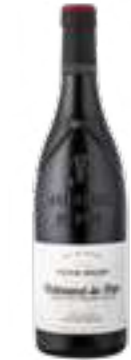
שאטו נף דו פאפ

תכולה: 750 מ"ל ברקוד: 3250670700107 גורם כפל: 6