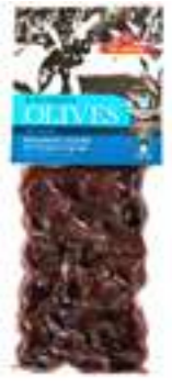
אילידה זיתי קלמטה

תכולה: 150 גרם ברקוד: 5201955150023 גורם כפל: 15 כשר