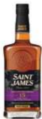
סיינט ג'יימס 15 שנים

תכולה: 700 מ"ל ברקוד: 3322177127029 אחוז אלכוהול: 43% גורם כפל: 6 כשר