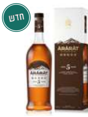
אררט 5 כוכבים

תכולה: 700 מ"ל ברקוד: 4850001001911 אחוז אלכוהול: 40% גורם כפל: 12