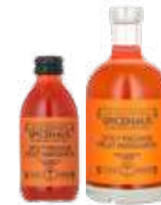
ספייסי מרגריטה פסיפלורה

תכולה: 500 מ"ל x 2 ברקוד: 7290019714750 גורם כפל: 1 כשר