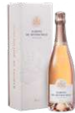
רוזה יבש במיוחד

תכולה: 750 מ"ל ברקוד: 3760183180018 גורם כפל: 6