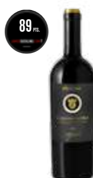
קולקסיונה אורו טוסקנה רוסי תכולה: 750 מ"ל ברקוד: 8002793017656 גורם כפל: 6