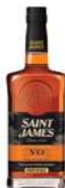
סיינט ג'יימס VO

תכולה: 700 מ"ל ברקוד: 3147699113776 אחוז אלכוהול: 40% גורם כפל: 6 כשר