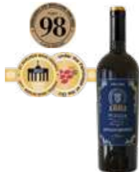
1882 אפימנטו פוליה תכולה: 750 מ"ל ברקוד: 8002793017250 גורם כפל: 6