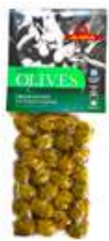
אילידה זיתים ירוקים עם אורגנו

תכולה: 150 גרם ברקוד: 5201955150054 גורם כפל: 15 כשר