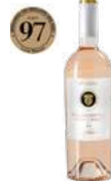
קולקסיונה אורו רוסיאנו טוסקנה תכולה: 750 מ"ל ברקוד: 8002793017649 גורם כפל: 6

CAMPAIGN FINANCED ACCORDING TO EU REG. N. 2021/2115