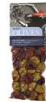
אילידה מיקס זיתים עם אורגנו

תכולה: 150 גרם ברקוד: 5201955150061 גורם כפל: 15 כשר