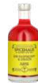
גין רסברי מיול

תכולה: 500 מ"ל ברקוד: 693493175463 גורם כפל: 12 כשר