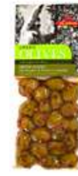
אילידה זיתים ירוקים עם אורגנו ופלפל אדום

תכולה: 150 גרם ברקוד: 5201955150047 גורם כפל: 15 כשר