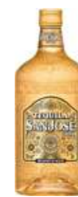
סאן חוזה גולד

תכולה: 700 מ"ל ברקוד: 3107872600394 אחוז אלכוהול: 35% גורם כפל: 6 כשר