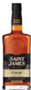
סיינט ג'יימס VSOP

תכולה: 700 מ"ל ברקוד: 3147699119198 אחוז אלכוהול: 43% גורם כפל: 6 כשר