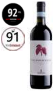
ואלפוליצ'לה סופיריור DOC

תכולה: 750 מ"ל ברקוד: 8019171000018 גורם כפל: 6