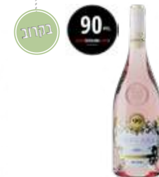
קולקסיונה פריבטה רוסיאנו תכולה: 750 מ"ל גורם כפל: 6