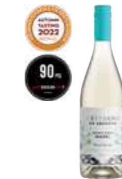
ארטסאנו מלבק לבן אורגני

תכולה: 750 מ"ל ברקוד: 7798130465846 גורם כפל: 6