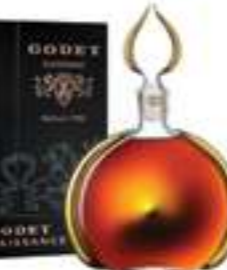
גודה רנסנס 70 שנה

תכולה: 700 מ"ל ברקוד: 3278480629234 אחוז אלכוהול: 40% גורם כפל: 1 כשר