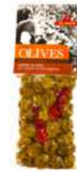
אילידה זיתים ירוקים עם אורגנו וצ'ילי

תכולה: 150 גרם ברקוד: 5201955150016 גורם כפל: 15 כשר