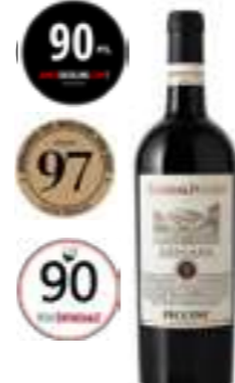
סאסו אל פוג'יו טוסקנה IGT תכולה: 750 מ"ל ברקוד: 8002793001228 גורם כפל: 6