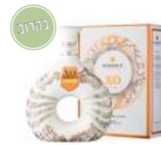
גודה XO TERRE קרמיקה

תכולה: 700 מ"ל ברקוד: 3278480396334 אחוז אלכוהול: 40% גורם כפל: 6 כשר