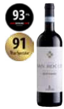
קאפיטל סאן רוקו ריפאסו DOC

תכולה: 750 מ"ל ברקוד: 8019171000193 גורם כפל: 6