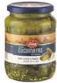
לינה מלפפונים בחומץ

תכולה: 690 גרם ברקוד: 8901483010505 גורם כפל: 12 כשר