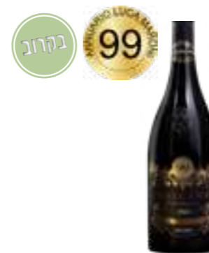
קולקסיונה פריבטה ביאנקו תכולה: 750 מ"ל גורם כפל: 6

MINISTERO DELL'AGRICOLTURA DELLA SOVRANITÀ ALIMENTARE E DELLE FORESTE