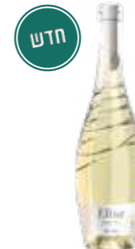
אליסה סנג'ובזה ביאנקו

תכולה: 750 מ"ל ברקוד: 8002793032062 גורם כפל: 6