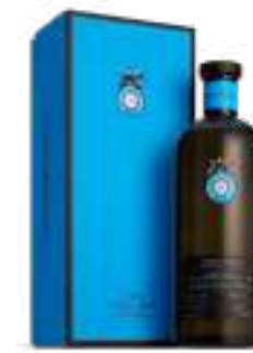
קאסה דרגונס אניחו

תכולה: 700 מ"ל ברקוד: 850005002321 אחוז אלכוהול: 40% גורם כפל: 6