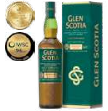
גלן סקוטיה ויקטוריאנה סינגל מאלט

תכולה: 700 מ"ל ברקוד: 5016840171218 אחוז אלכוהול: 46% גורם כפל: 6 כשר