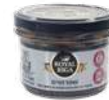
דגי שפרוטים מעושנים בשמן צמחי

תכולה: 170 / 160 גרם ברקוד: 7290019286387 / 7290019286394 גורם כפל: 24 כשר