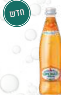
בורג'ומי לימונטי מנדרינה

תכולה: 500 מ"ל ברקוד: 4860019003364 גורם כפל: 12 כשר