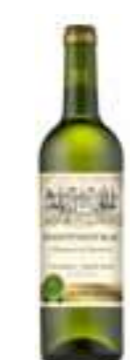
מונטמראק לבן יבש

תכולה: 750 מ"ל ברקוד: 3500610098246 גורם כפל: 6