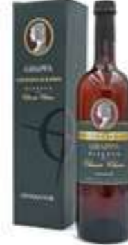
גראפה קונסטה די ראדה רזרבה תכולה: 750 מ"ל ברקוד: 8000757000744 גורם כפל: 6