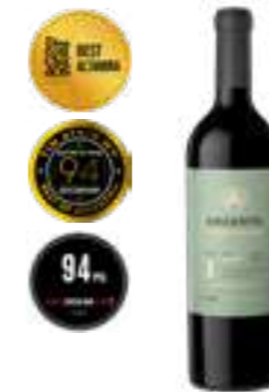
פינקה אלטה-מירה מלבק סינגל בלוק

תכולה: 750 מ"ל ברקוד: 7798130463514 גורם כפל: 6