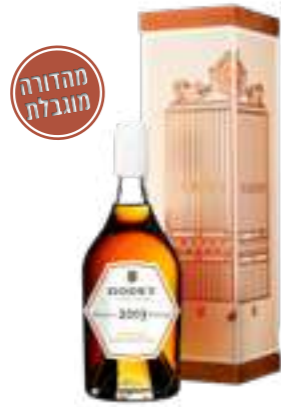
גודה וינטאז' חבית יחידנית 2003

תכולה: 700 מ"ל ברקוד: 3278485937181 אחוז אלכוהול: 43% גורם כפל: 6 כשר