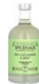
גין מלפפון ונענע

תכולה: 700 מ"ל ברקוד: 7290019714712 גורם כפל: 12 כשר