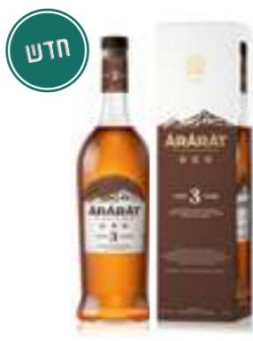
אררט 3 כוכבים

תכולה: 700 מ"ל ברקוד: 4850001007722 אחוז אלכוהול: 30% גורם כפל: 12