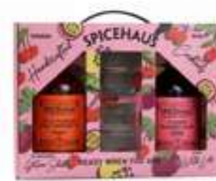
מארז זוגי + 2 כוסות

תכולה: 700 מ"ל ברקוד: 693493175418 גורם כפל: 1 כשר