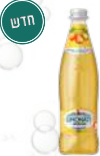
בורג'ומי לימונטי אגס

תכולה: 750 מ"ל ברקוד: 3068320014067 גורם כפל: 6 כשר