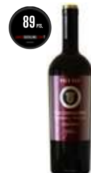
קולקסיונה אורו מארמה רזרבה תכולה: 750 מ"ל ברקוד: 8002793024333 גורם כפל: 6