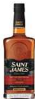
סיינט ג'יימס XO

תכולה: 700 מ"ל ברקוד: 3147699119013 אחוז אלכוהול: 43% גורם כפל: 6 כשר