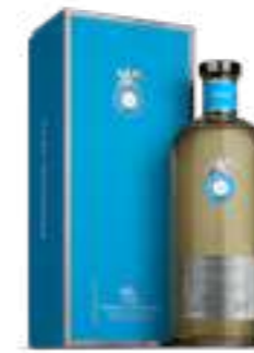
קאסה דרגונס רפוסאדו

תכולה: 700 מ"ל ברקוד: 736040537120 אחוז אלכוהול: 40% גורם כפל: 6