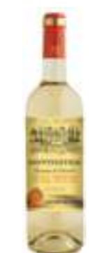
מונטמראק לבן חצי יבש

תכולה: 750 מ"ל ברקוד: 3500610098246 גורם כפל: 6