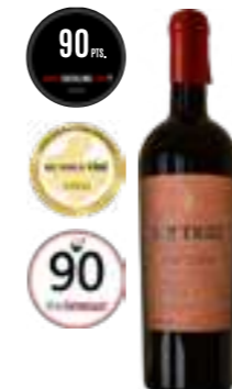
היסטריו אנפורה אורגני רוסו

תכולה: 750 מ"ל ברקוד: 8002793025057 גורם כפל: 6