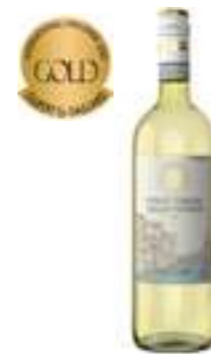
פינו גריג'ו דה לה ונציה IGT

תכולה: 750 מ"ל ברקוד: 8000757007644 גורם כפל: 6