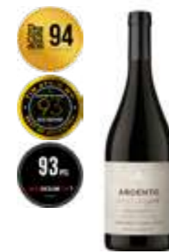
פינקה אגרלו קברנה פרנק

תכולה: 750 מ"ל ברקוד: 7798130465631 גורם כפל: 6