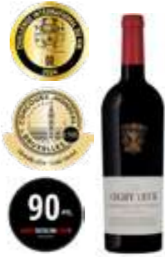
הברווז הזעם רזרב קברנה סוביניון תכולה: 750 מ"ל ברקוד: 5600206949421 גורם כפל: 6