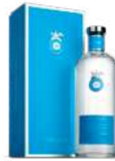
קאסה דרגונס בלאנקו

תכולה: 700 מ"ל ברקוד: 638478001054 אחוז אלכוהול: 35% גורם כפל: 6