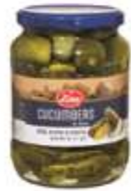
לינה מלפפונים במלח

תכולה: 690 גרם ברקוד: 7290014910386 גורם כפל: 12 כשר