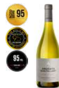
פינקה גואלטאלארי שרדונה

תכולה: 750 מ"ל ברקוד: 7798325470228 גורם כפל: 6