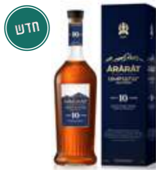
אררט אחטמר 10 שנים

מותג הברנדי הארמני המפורסם ביותר, המזוקק בעיר ירוואן מאז 1887. מיוצר מענבים מקומיים וישון בחביות עץ אלון קווקזי, הוא מציע פרופיל עשיר וחלק עם ניחוחות פירות יבשים, דבש, וניל ותבלינים עדינים. סדרת הברנדים של אררט כוללת ביטויים מגוונים, החל מגרסאות צעירות ורעננות ועד למהדורות מיושנות ויוקרתיות. זהו ברנדי בעל היסטוריה עמוקה, המשמש כסמל למסורת ותרבות ארמנית.