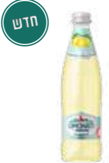
בורג'ומי לימונטי לימונדה

תכולה: 500 מ"ל ברקוד: 4860019003302 גורם כפל: 12 כשר