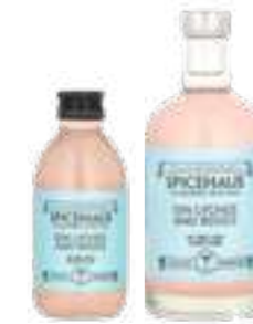
גין ליצי ורדים

תכולה: 500 מ"ל / 200 מ"ל ברקוד: 693493175135/693493175456 גורם כפל: 12/24 כשר