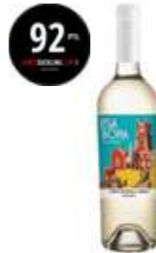
ליסה בונה רזרב לבן תכולה: 750 מ"ל ברקוד: 5600206949650 גורם כפל: 6