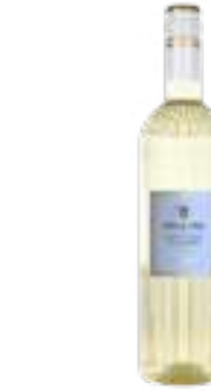
מילריגה פינו גריג'ו דה לה ונציה DOC

תכולה: 750 מ"ל ברקוד: 8002793959789 גורם כפל: 6