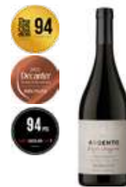
פינקה אגרלו מלבק

תכולה: 750 מ"ל ברקוד: 7798130463507 גורם כפל: 6