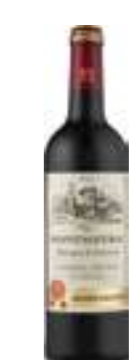
מונטמראק אדום יבש

תכולה: 750 מ"ל ברקוד: 3500910096600 גורם כפל: 6