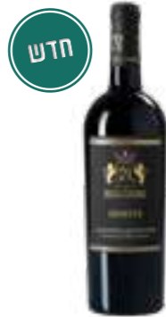
ג'נסי אליניקו דל ולטורה DOC תכולה: 750 מ"ל ברקוד: 8007674005678 גורם כפל: 6