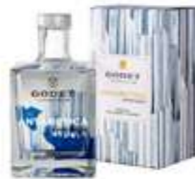
גודה אנטרקטיקה - קוניאק שקוף

תכולה: 750 מ"ל ברקוד: 3278486420545 אחוז אלכוהול: 17% גורם כפל: 6