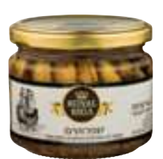
דגי שפרוטים מעושנים בשמן צמחי

תכולה: 280 גרם ברקוד: 7290017744162 גורם כפל: 12 כשר