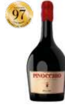
פינקווי - רוסי דה אטליה תכולה: 750 מ"ל ברקוד: 8002793021196 גורם כפל: 6