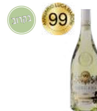
קולקסיונה פריבטה ביאנקו תכולה: 750 מ"ל גורם כפל: 6