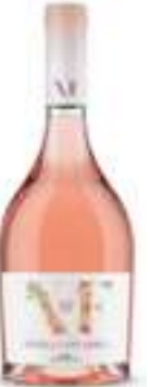
סיירה קאנטבריה XF רוזה יבש תכולה: 1.5 ליטר / 750 מ"ל ברקוד: 8414581710005 / 8414581710029 גורם כפל: 6