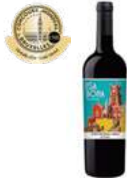
ליסה בונה רזרב אדום תכולה: 750 מ"ל ברקוד: 5600206949445 גורם כפל: 6