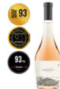
אורוניה 45 פטגוניה רוזה יבש

תכולה: 750 מ"ל ברקוד: 7798130463187 גורם כפל: 6