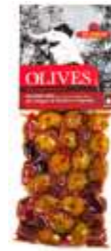
אילידה מיקס זיתים עם אורגנו ופלפל אדום

תכולה: 900 גרם ברקוד: 7290019286363 גורם כפל: 16 כשר