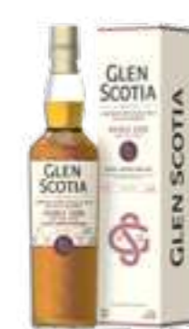
גלן סקוטיה דאבל קאסק סיומת רום סינגל מאלט

תכולה: 700 מ"ל ברקוד: 5016840150213 אחוז אלכוהול: 53.3% גורם כפל: 6