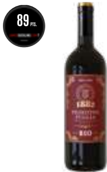
1882 פרימיטבו פוליה BIO תכולה: 750 מ"ל ברקוד: 8002793024296 גורם כפל: 6