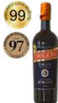
סולקו אפיטו תכולה: 750 מ"ל ברקוד: 8002793020090 גורם כפל: 6