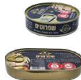
דגי שפרוטים מעושנים בשמן צמחי

תכולה: 170 / 160 גרם ברקוד: 7290019286387 / 7290019286394 גורם כפל: 24 כשר