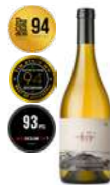
אורוניה 45 פטגוניה לבן יבש

תכולה: 750 מ"ל ברקוד: 7798130465853 גורם כפל: 6